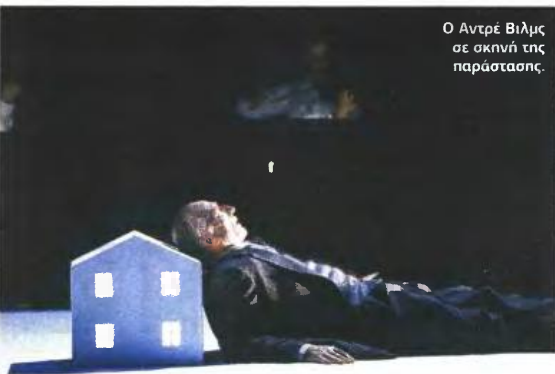
Ο Αντρέ Βιλμς σε σκηνή της παράστασης.

Σας προβληματίζει το γεγονός ότι το καλλιτεχνικό σας ιδίωμα ολοένα και διευρύνεται;